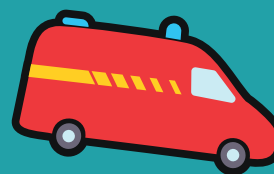
Attendre l'autorisation des pompiers ou du chauffagiste pour y retourner