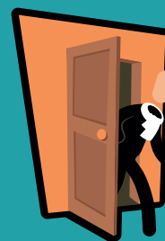
Sortir du logement ou du bâtiment