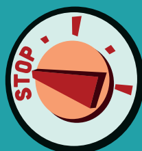
Arrêter le chauffage