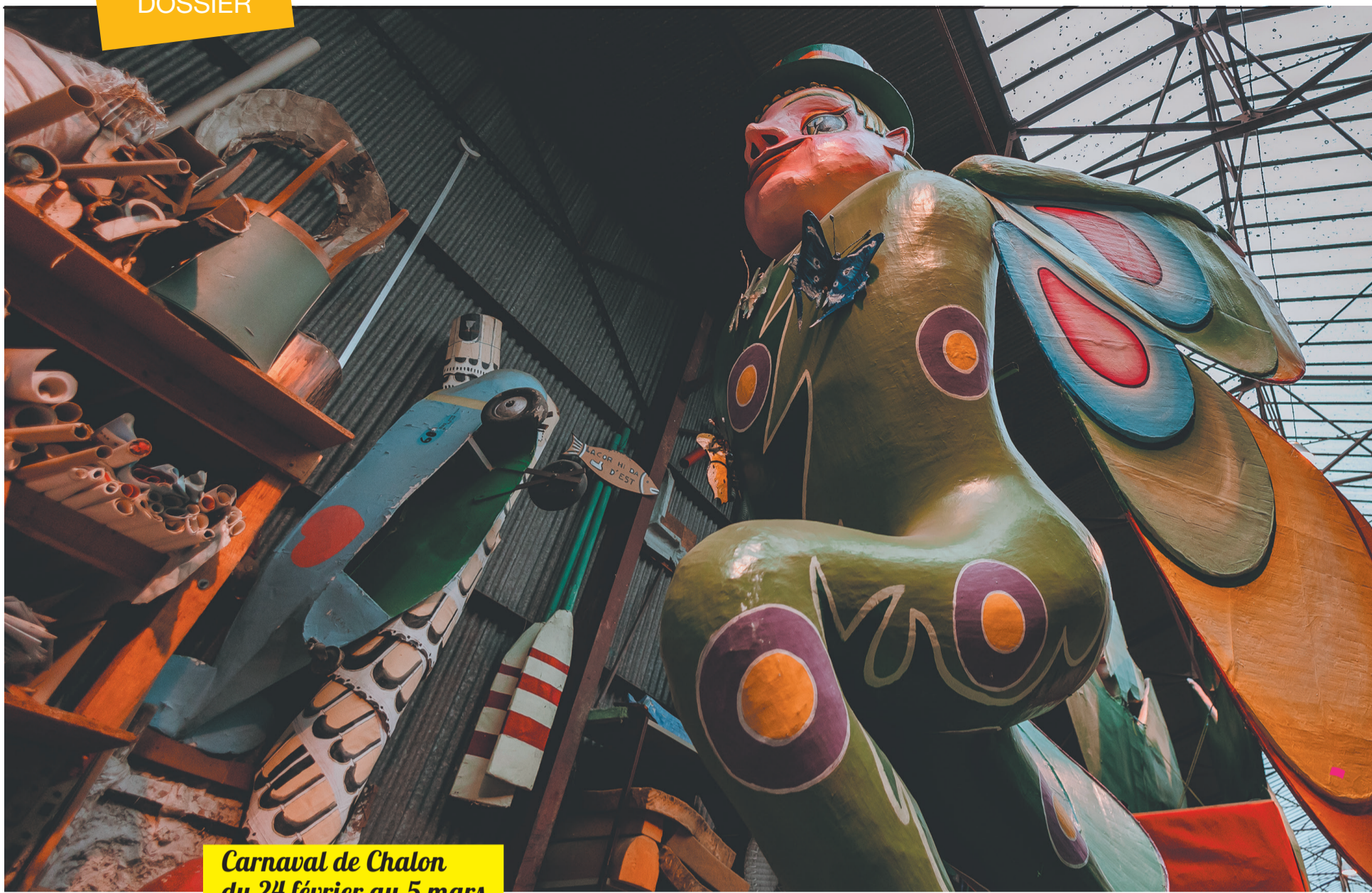
Carnaval de Chalon du 24 février au 5 mars