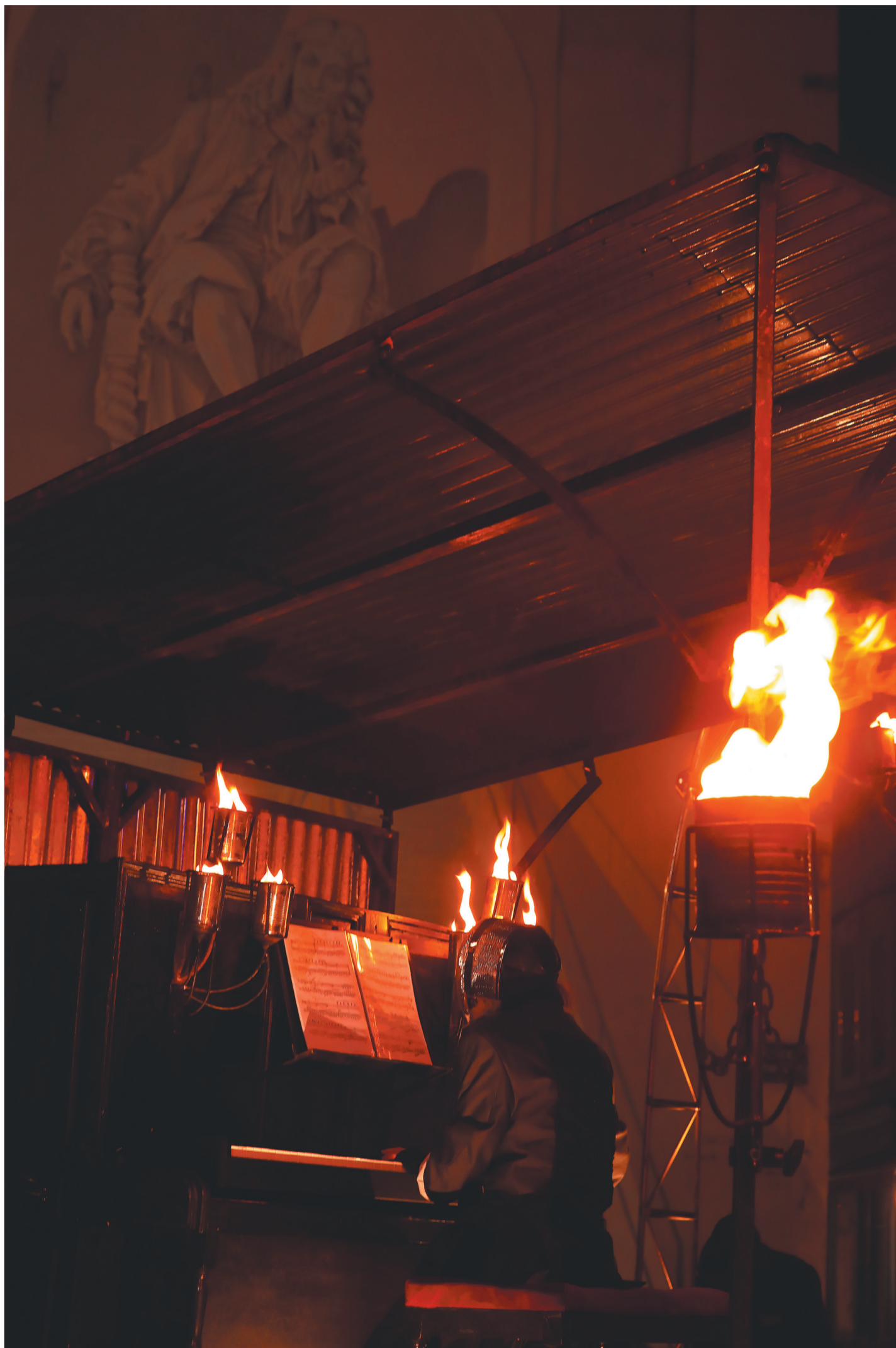
6 8 décembre magique à Chalon grâce aux installations éphémères de la Compagnie des Mangeurs de cercle dans les rues piétonnes.