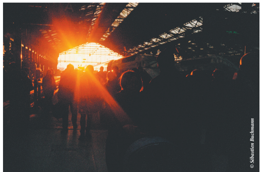
Exposition Cinematographer Du 25 février au 21 mai 2023

➔ Retrouvez le programme, les tarifs et toutes les infos sur le site de l'événement : www.festivalchefsop.fr