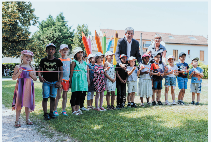
Un million d'euros investi chaque année depuis 2016 dans l'entretien de nos écoles.

tions et les clubs organisent. Si nous arrivons pour cette nouvelle année à rester sur cette tendance-là, nous aurons contribué modestement, mais sûrement, à avoir une ville apaisée au milieu d'un monde bien troublé.