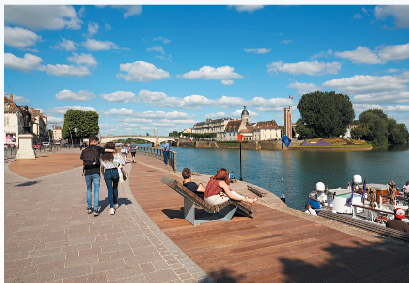
« Mon grand bonheur, c'est de voir, au moindre rayon de soleil, le nombre de Chalonnais qui profitent de ces quais désormais rénovés. »

Le site a également une vocation culturelle avec le futur musée sur lequel nous travaillons d'arrache-pied en collaboration avec l'État, nos collections étant d'intérêt national voire international. Nous possédons tout de même le premier appareil photo au monde ! Avec ce projet, nous restons fidèles à nos origines : Nicéphore Niépce et la photographie sont nés à Chalon. Nous sommes attachés à cette invention qui continue à révolutionner le monde puisque l'image a envahi toute notre vie. Ce futur musée aura aussi la vocation d'être un levier de développement économique et touristique, car nous voulons qu'il soit à la hauteur de l'importance de cette invention. Son rayonnement ira bien au-delà de nos frontières régionales et nationales. Le site de l'ancien hôpital sera mis en valeur et ses cours intérieures seront utilisées comme espaces d'expositions et de rencontres.