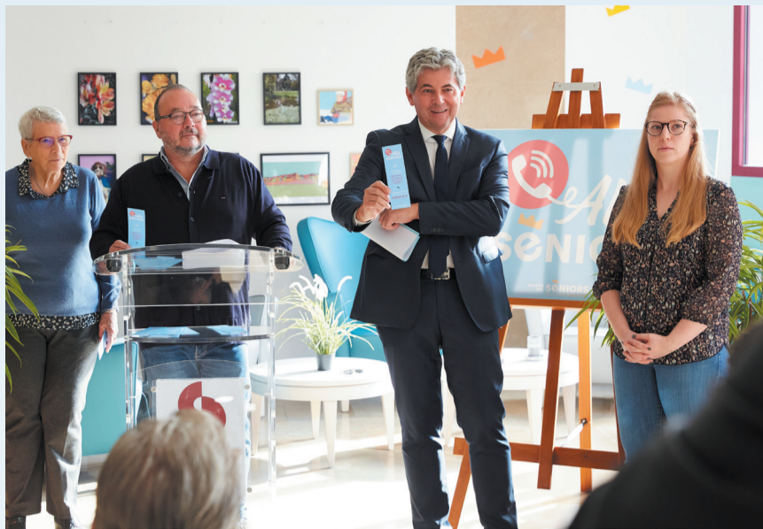
« Allô Seniors » apporte des réponses à tous les Chalonnais de plus de soixante ans.

OC : Lors des conseils municipaux, on entend parfois parler de la dette. Qu'en pensez-vous ?