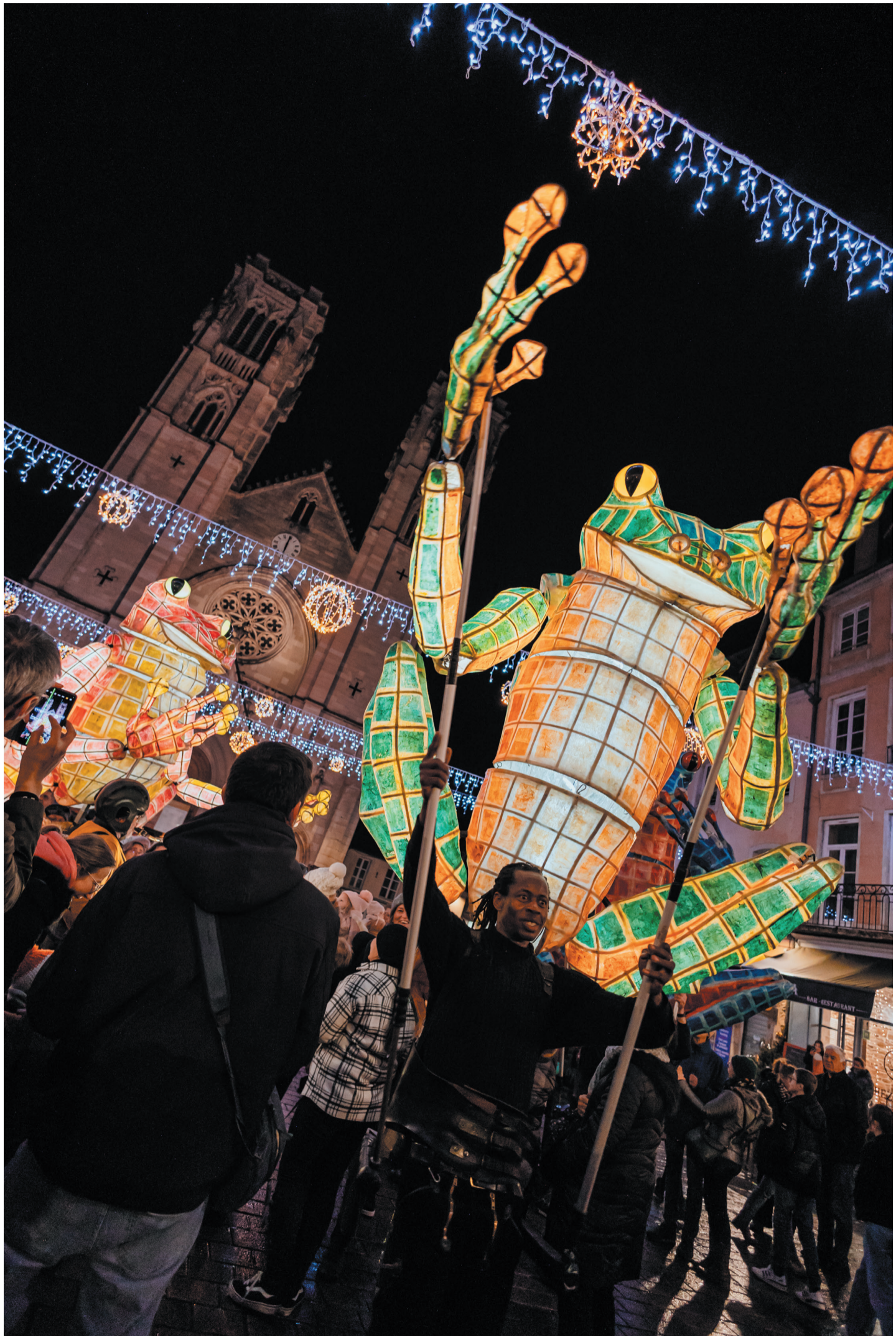
6 La déambulation lumineuse et en musique de la Compagnie Caramantran a réuni les Chalonnais pour la Fête des lumières du 8 décembre