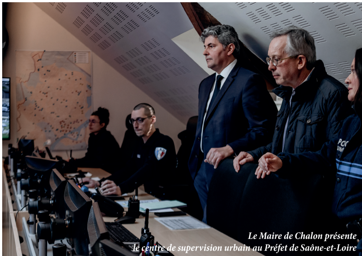
Le Maire de Chalons-sur-Saône présente le centre de supervision urbain au Préfet de Saône-et-Loire