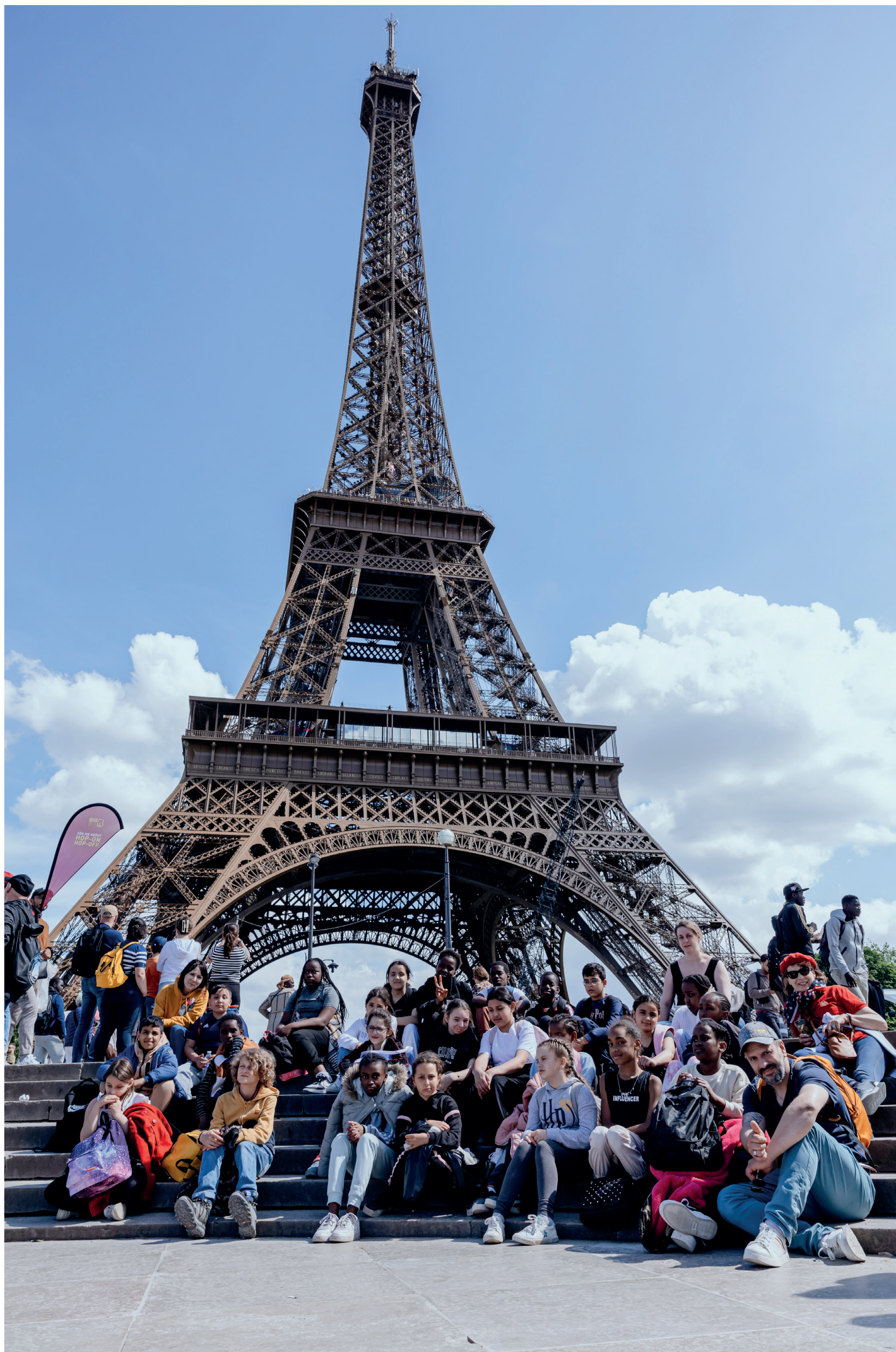
6 Les élèves chalonais de CM2 , en voyage à Paris, ont eu l'opportunité de découvrir les lieux incontournables de la capitale