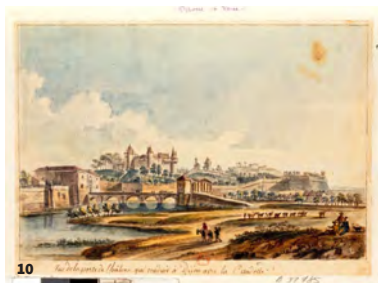
10. Vue de la porte de Beaune et de la Citadelle royale, gravure de Jean-Baptiste Lallemand (1780)