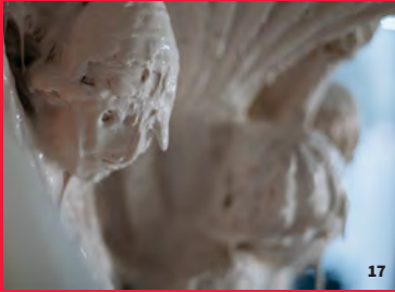
17. Moulage du chapiteau Abel et Caïn